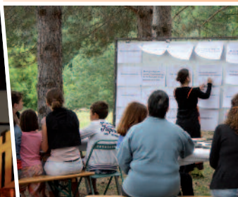
2012 -Contes au fil de l'eau.