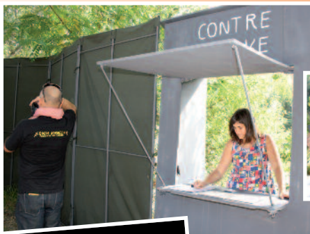
2012- Contre nature C ie Tricyclique Dol Pronomade(s).