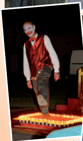
2012 - Un dernier tour de piste C ie des femmes à barbe Pronomade(s).