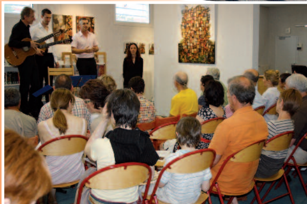
2012 - Vernissage concert exposition Nabarus.