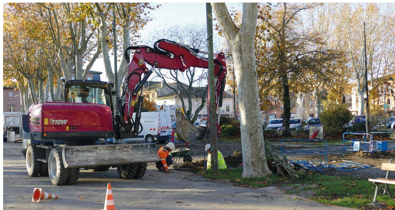
Les travaux sont programmés jusqu'à fin mars 2025 : 1. terrassement / 2. remplacement de l'éclairage public / 3. mise en place de coffrets forains.