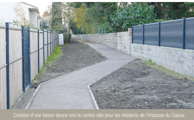
Création d'une liaison douce vers le centre-ville pour les résidents de l'impasse du Claous.