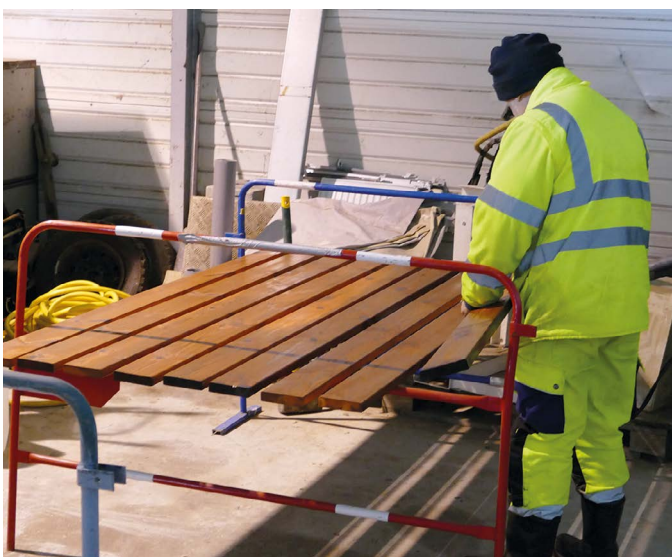
Première étape de la fabrication des bancs : application de plusieurs couches de lasure sur les lattes.

Depuis l'ouverture du pumptrack, fin octobre, la fréquentation du Bois de Castres a considérablement augmenté. Pour agrémenter l'installation le service « Espaces Urbains » conçoit plusieurs bancs.