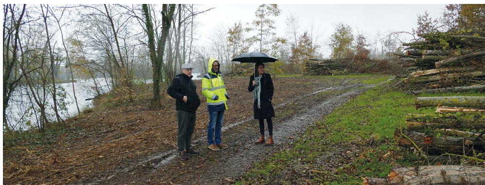
Les peupliers coupés sont transformés en plaquettes qui, après séchage, seront valorisées comme combustible pour chaudières à bois.

état. Les troncs abattus sont récupérés par l'entreprise spécialisée pour être valorisés. Les souches sont broyées et le terrain aplani afin de favoriser la repousse du tapis végétal.