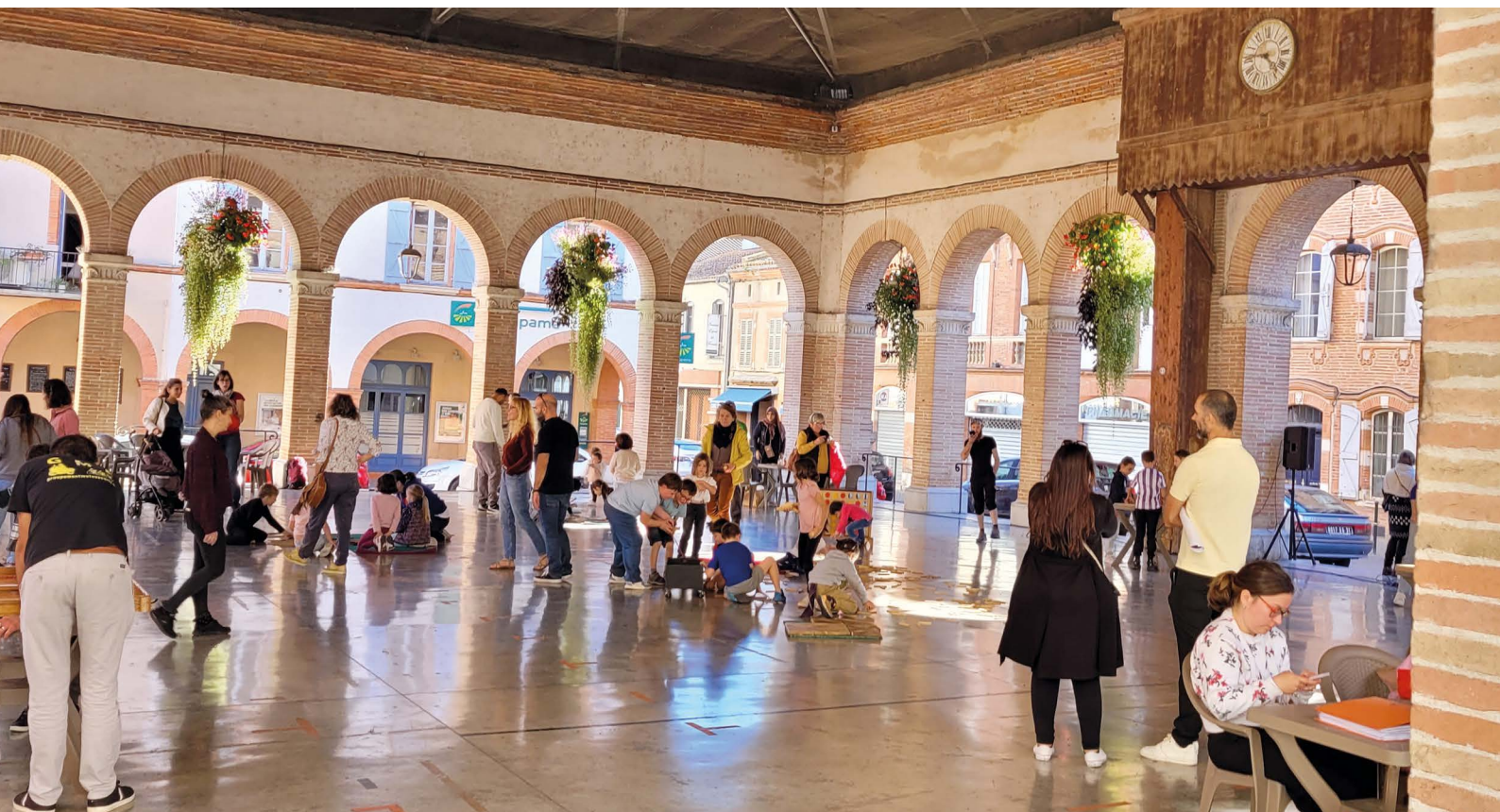
« Halle aux Jeux » de septembre à décembre, tous les samedis après-midi, sous la halle avec des temps forts quelques jours avant Noël.