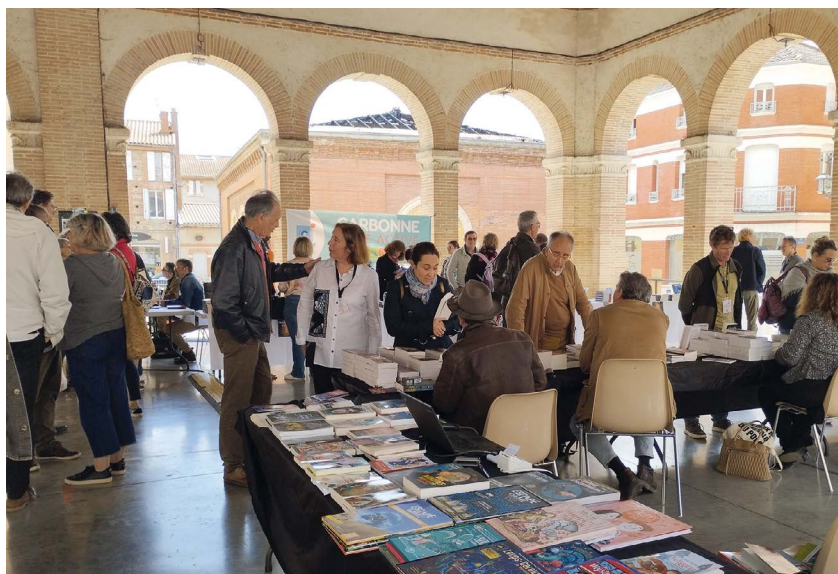
Samedi 1 er juin 2024 - « Empreinte Carbone » rencontres polar.