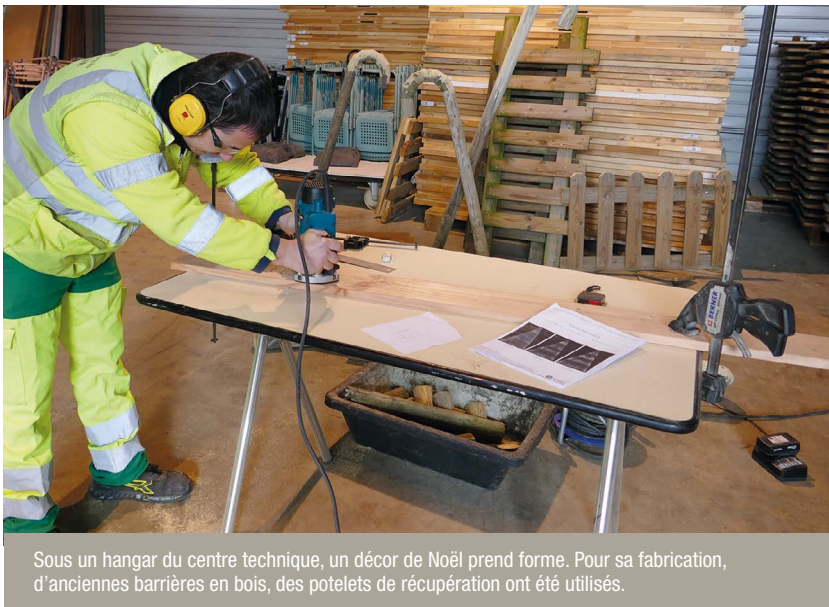
Sous un hangar du centre technique, un décor de Noël prend forme. Pour sa fabrication, d'anciennes barrières en bois, des potelets de récupération ont été utilisés.

À l'approche des fêtes de Noël et pour rendre le centre-ville attractif, la place de la République se pare, cette année, d'un beau et grand sapin lumineux. Pour que la magie opère davantage, des agents du service « Espaces Urbains » ont été missionnés pour confectionner une petite mise en scène. Avec de l'imagination, une bonne dose d'ingéniosité, de savoir-faire et quelques matériaux de récupération, ils ont créé un décor !