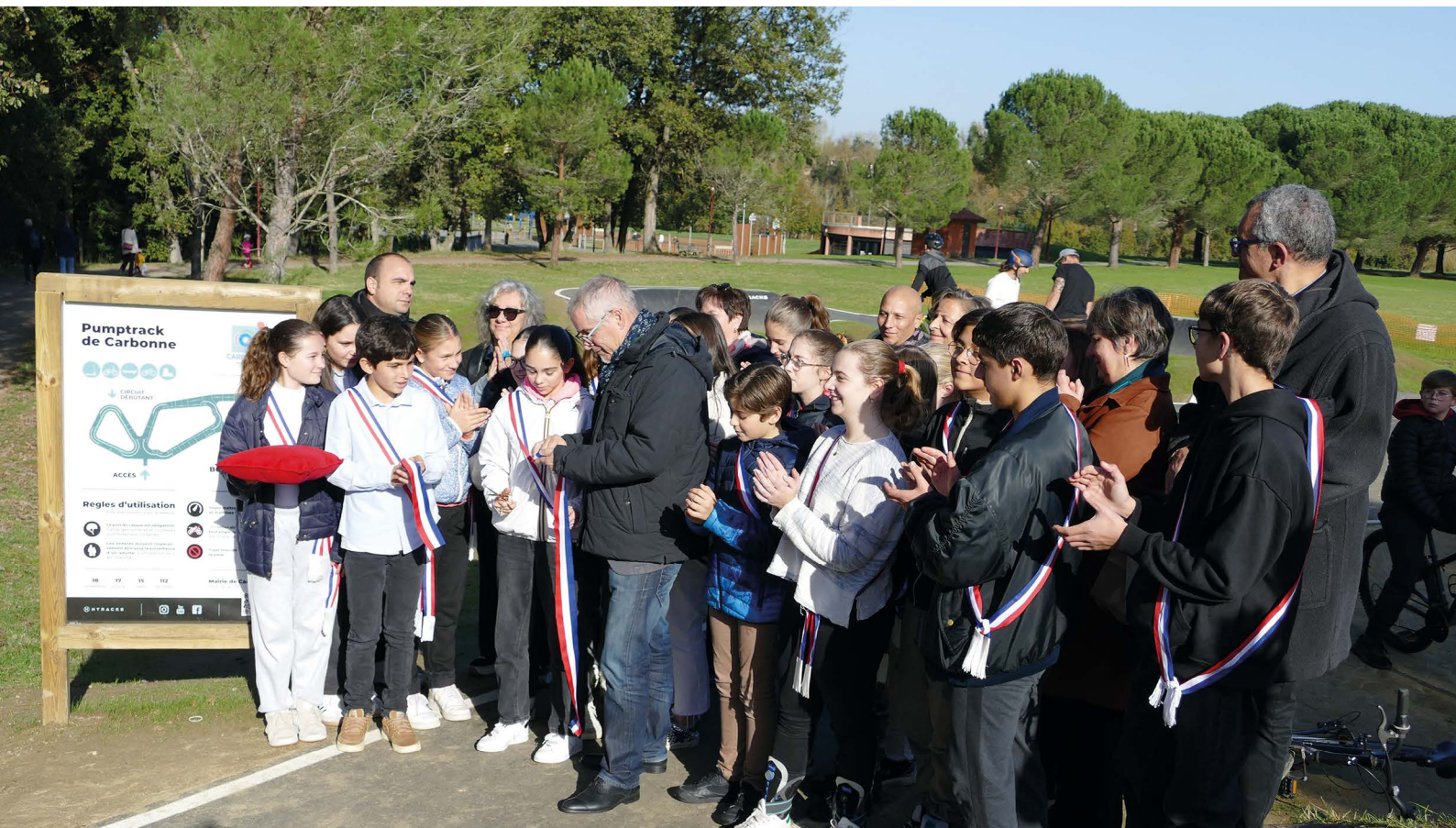
Lors de l'inauguration, les jeunes étaient fiers de la réalisation de cette installation qui incite à l'activité physique et est un véritable lieu de rencontre intergénérationnelle.