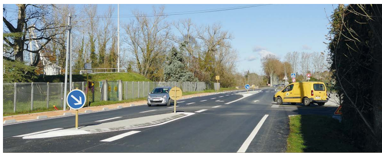
Le tourne-à-gauche sécurise également l'accès à l'aire d'accueil des gens du voyage créée par la communauté de Communes du Volvestre.

Il sécurise l'intersection entre la route de Rieux et la route de Latrape.