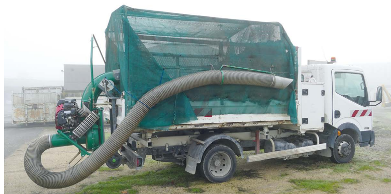
L'armature de métal recouverte d'un filet montée sur un camion plateau permet le ramassage d'un grand volume de feuilles.

Ah ! Qu'il est agréable, en été, de se promener ou de s'asseoir à l'ombre des nombreux platanes qui jalonnent les rues et les places de Carbonne ! Mais à l'automne, le volume de feuilles à ramasser est considérable ! Pour gagner du temps sur cette tâche chronophage, les agents, avec la complicité du responsable de l'atelier mécanique, ont conçu un aménagement saisonnier sur un des camions du parc de véhicules.