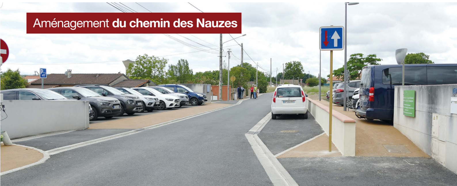
Chemin des Nauzes, aux abords du Centre Médico Psychologique et de l'Unité de Psychiatrie de l'enfant et de l'adolescent : création de places de parking et aménagement de la chaussée pour réduire la vitesse des véhicules.